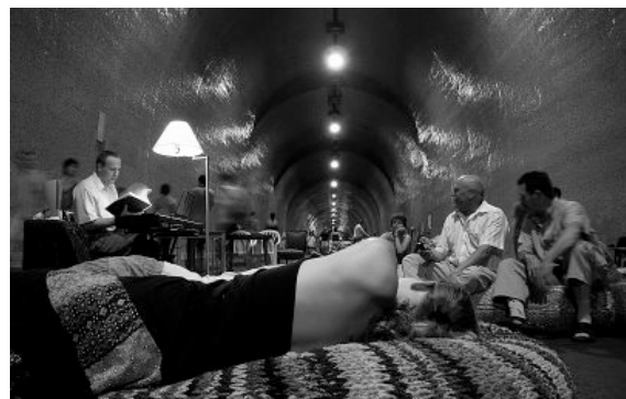
Bárzongorista az Alagútban

300 ezer forinttal támogatta a szervezési költségeket és a szükséges felszerelések beszerzését.