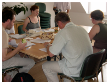
Az Adományi Bizottság ülése

Az Ökotárs Alapítvány– mely fennállása óta mintegy 410 millió forinttal támogatta a hazai és határon túli civil szervezeteket – Adományi Bizottsága június 22-én meghozta az idei második fordulóban beadott pályázatok támogatására vonatkozó döntését. A benyújtott 47 pályázatból 13 részesült adományban, összesen 4,3 millió forint értékben. A támogatott szervezetek listája elérhető az Ökotárs Alapítvány honlapján . Néhány a támogatott projektek közül: